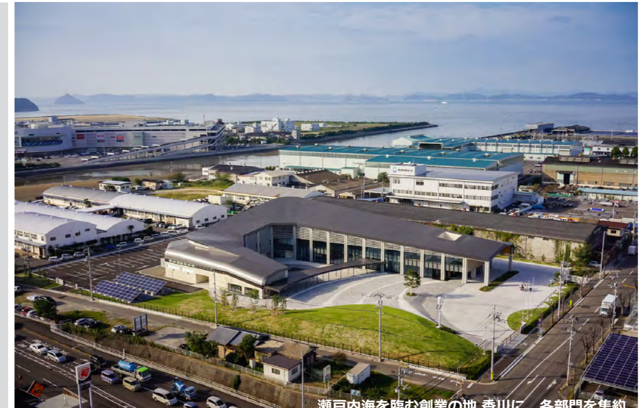
瀬戸内海を臨む創業の地香川に、各部門を集約

This project involved design and construction of a new company core office building for FUSO Corporation, the water technology corporation. The new building is planned as a single continuous office with the large roof designed to resemble flowing water. The roof is supported by a keel truss that passes through the building like a backbone. From the central courtyard, the breeze blows to the north where the apex of the keel truss is located, and the courtyard also ensures a stable supply of sunlight entering building. In addition, neighborhood residents can also use the restaurant, gymnasium and garden, and will be opened as a shelter when a disaster happens. And, by actively using local building materials, we made it an office that conveys the value of local industries.