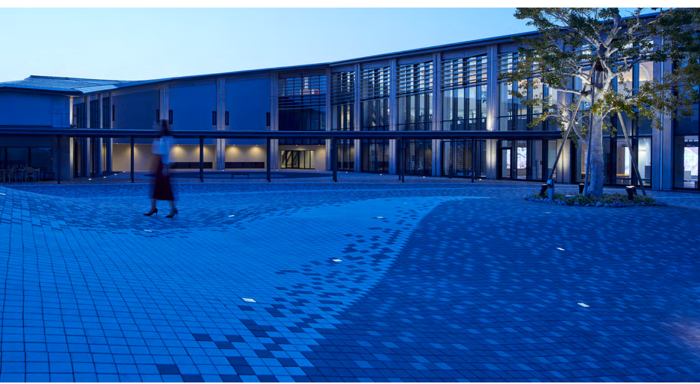
地域用備蓄倉庫も備えた体育館