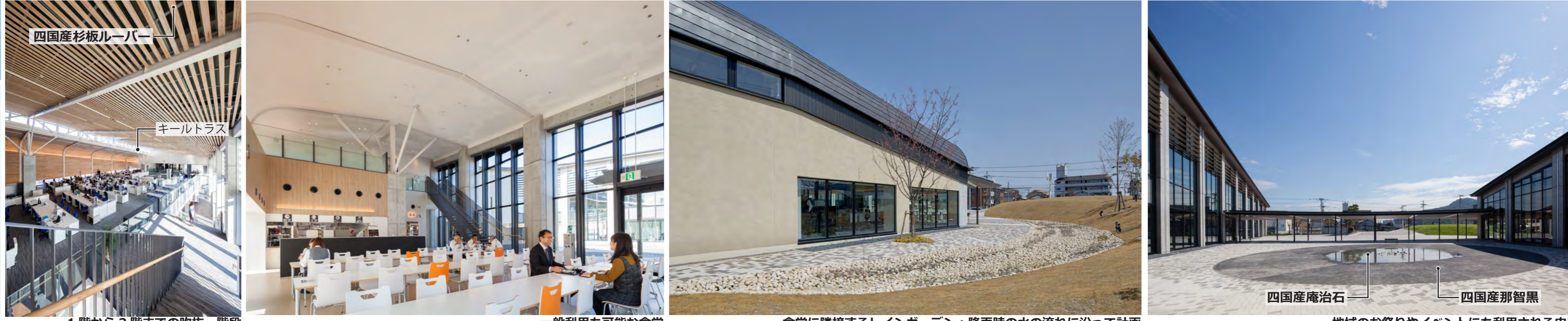
1階から3階までの吹き抜け、階段

地域とともに成長するオフィス 地元建材の積極的な利用のほか、食堂の一般開放や体育館を避難所として計画。地域のお祭りを中庭で開催するなど、誰でも利用できるオープンな環境とし、「近隣との関係を育てていくオフィス」を目指しました。