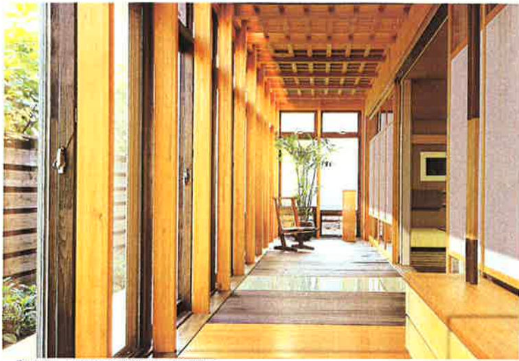
① 横は窓あり 扉を開くと緑の庭園が広がり景色を再確認することができる