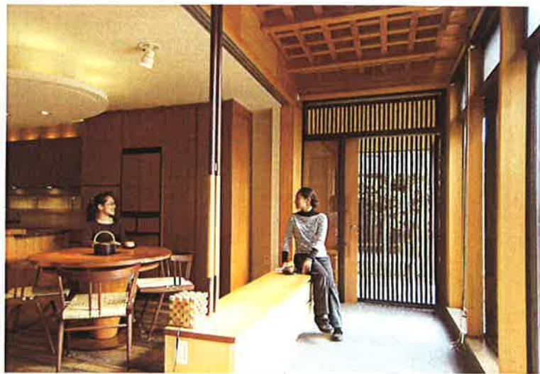
② 玄関の廊下(下駄箱) 足音と緑や木につく住環境を再確認して暮らす「三軸」の暮らしは緑が美しい